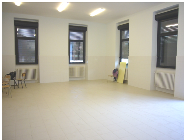
La sala mensa della scuola dell'infanzia di Cura di Vetralla, completamente rinnovata

La scuola dell'infanzia di Piazza Cavour funzionerà con soltanto tre sezioni, ad orario pieno, al piano terra. Altre due sezioni ad orario pieno (la sez. B e la E) ed una sezione ad orario antimeridiano saranno trasferite presso la scuola di Mazzocchio (ex scuola elementare).